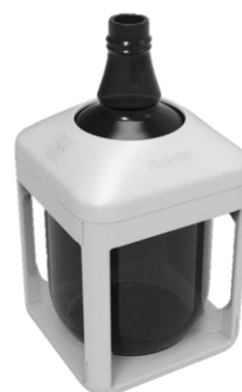
ガロン瓶専用保護ジャケット ガロテクト™